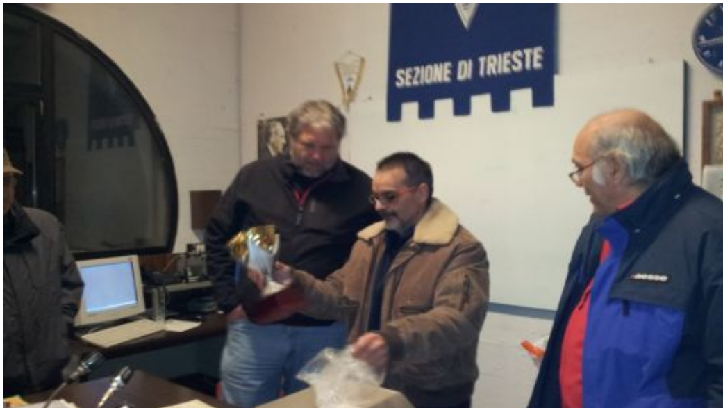
Other prizes awarded IV3SIX Claudio, S55M, IV3KAS